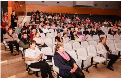
UTŽO Žalec: To smo mi!