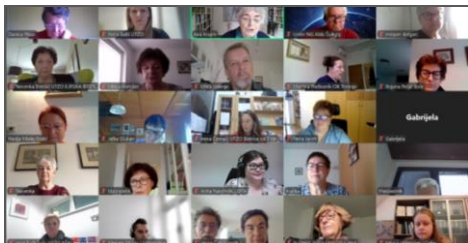
Posvet mreže SUTŽO o uporabi spletnih medijev