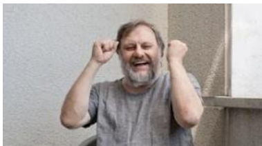
Slavoj Žižek.

Se je mogoče postarati in živeti bogato izpolnjujoče življenje? Elke Heidenreich se je ukvarjala z vprašanjem staranja. »Rezultat je knjiga, ki jo lahko napiše samo ona«, pravijo kritiki: osebna, iskrena, a nikoli neusmiljena, življenjska izpoved. Elke razmišlja o svojem lastnem življenju in predvsem o odnosih. »Starost je posledica vsega, kar si kdaj storil«, pravi. S starostjo pride spokojnost in tedaj spoznaš, da je večina stvari povsem nepomembnih. »Treba je samo dihati in biti hvaležen.« Delo Alteren je žal samo v nemškem jeziku.