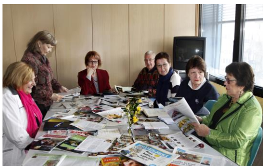
V uredništvu novinarskega študijskega krožka