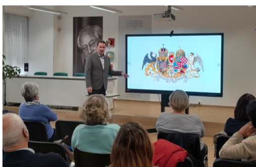
Grboslovje v Enajsti šoli v knjigarni 5. november 2024

Vonj pečenega kostanja, ki ga v mesto prinese jesen, vsakič naznanja nove začetke. Nikoli končan proces učenja v šolske klopi spet zvabi stare in nove sošolce, da zadiši po druženju in novih poznanstvih. Tudi novinarska skupina Slovenske univerze za tretje življenjsko obdobje, ki že poldrugo desetletje v svet besednih iger in jezikovnih odtenkov privablja nove člane, je začela z delom. Ste radovednež, ki svoja opažanja rad zapiše in predaja naprej? Potem veste, da uporabne informacije in dobro zapisane misli vedno pritegnejo. Če radi premetavate in iščete ustrezne besede, preden jih zapišete ali pa čutite, da bi pisanje lahko bilo izrazni kanal vaši kreativnosti, z veseljem vabljeni, da se jim pridružite. Srečanja novinarskega krožka SUTŽO so vsak četrtek ob 10. uri na Dunajski cesti 101 v Ljubljani in trajajo dve pedagoški uri.