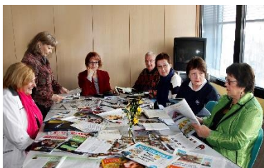
V uredništvu novinarskega študijskega krožka