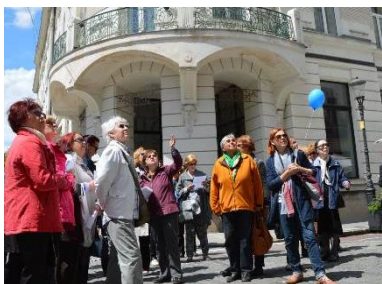
Vodeni ogled po Fabianijevi Ljubljani