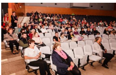
UTŽO Žalec: To smo mi!