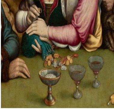
Quentin Metsys; Le mariage inégal. Olje na deski. 1525- 1530 (slov. Neuravnotežena poroka). Fragment. 1525.