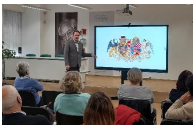
Grboslovje v Enajsti šoli v knjigarni 5. november 2024

Vonj pečenega kostanja, ki ga v mesto prinese jesen, vsakič naznanja nove začetke. Nikoli končan proces učenja v šolske klopi spet zvabi stare in nove sošolce, da zadiši po druženju in novih poznanstvih. Tudi novinarska skupina Slovenske univerze za tretje življenjsko obdobje, ki že poldrugo desetletje v svet besednih iger in jezikovnih odtenkov privablja nove člane, je začela z delom. Ste radovednež, ki svoja opažanja rad zapiše in predaja naprej? Potem veste, da uporabne informacije in dobro zapisane misli vedno pritegnejo. Če radi premetavate in iščete ustrezne besede, preden jih zapišete ali pa čutite, da bi pisanje lahko bilo izrazni kanal vaši kreativnosti, z veseljem vabljeni, da se jim pridružite. Srečanja novinarskega krožka SUTŽO so vsak četrtek ob 10. uri na Dunajski cesti 101 v Ljubljani in trajajo dve pedagoški uri.