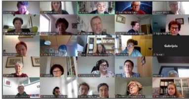
Posvet mreže SUTŽO o uporabi spletnih medijev