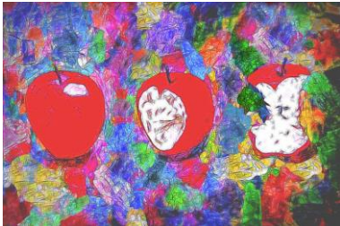
William Lee Hankey: Tri stopnje življenja