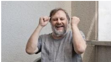
Slavoj Žižek.

Se je mogoče postarati in živeti bogato izpolnjujoče življenje? Elke Heidenreich se je ukvarjala z vprašanjem staranja. »Rezultat je knjiga, ki jo lahko napiše samo ona«, pravijo kritiki: osebna, iskrena, a nikoli neusmiljena, življenjska izpoved. Elke razmišlja o svojem lastnem življenju in predvsem o odnosih. »Starost je posledica vsega, kar si kdaj storil«, pravi. S starostjo pride spokojnost in tedaj spoznaš, da je večina stvari povsem nepomembnih. »Treba je samo dihati in biti hvaležen.« Delo Alteren je žal samo v nemškem jeziku.