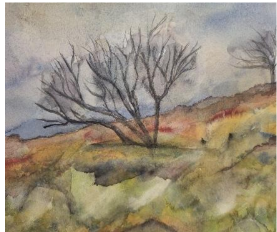
Miha Koželj: Kras