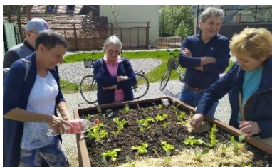
Ob visokih gredah.