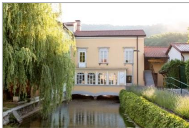
Vencinova hiša, ki sredi mesta preči rečico