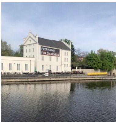
Praga, novi Muzej sodobne umetnosti vodijo starejši prostovoljci

Povezava na spletno stran projekta: https://www.see-u-project.eu