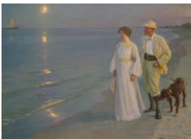
P. S. Krøyer (1851-1909): Skagen. Slika danskega slikarja iz serije Modra svetloba