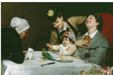
Carolus-Duran (1837-1917): Merrymakers, 1870, olje na platnu.