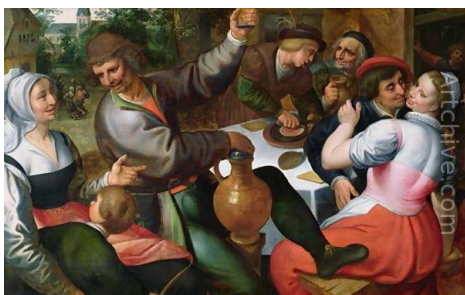
Marten Van Cleve: Portret srednjeveške prostitutke